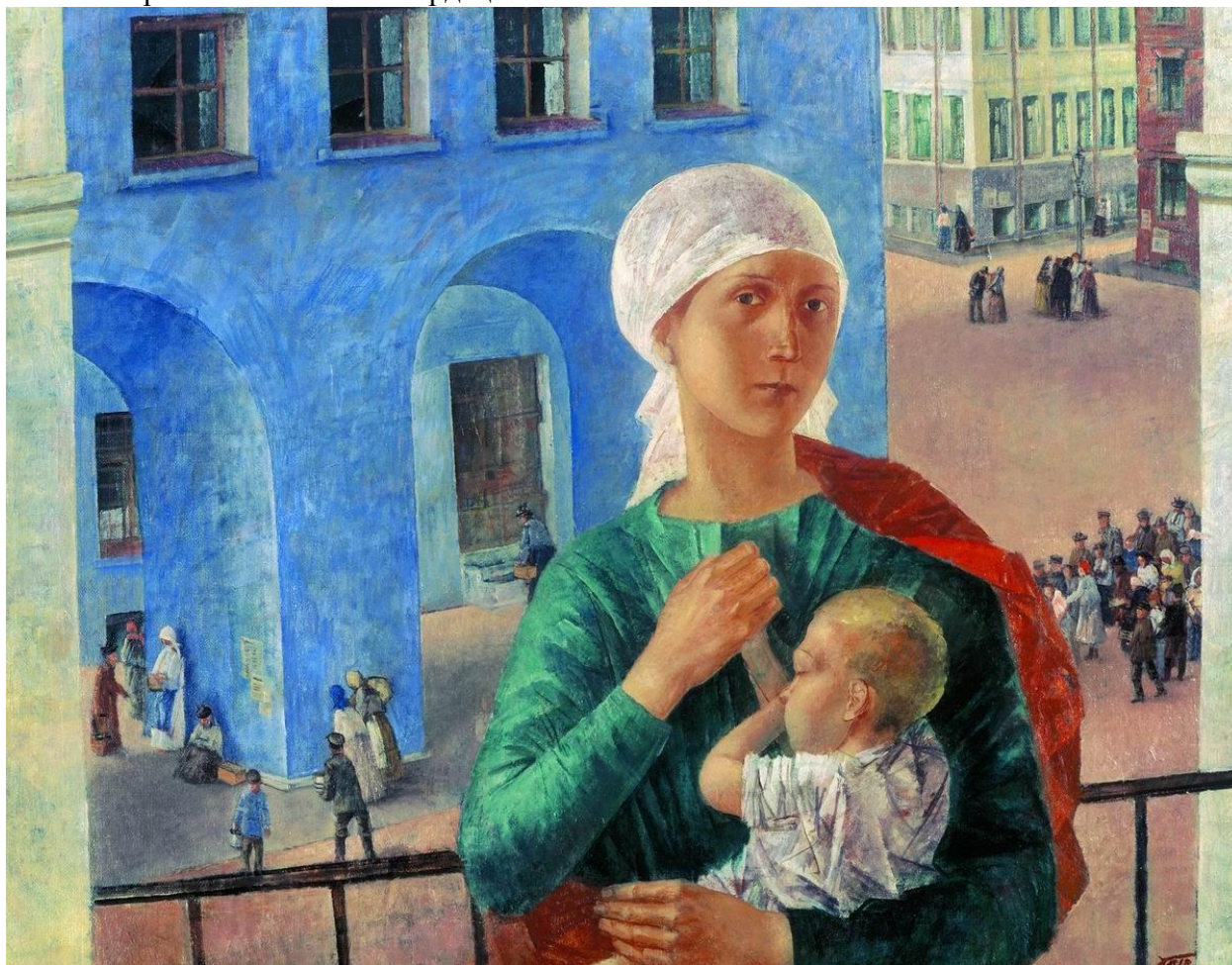
Кузьма Сергеевич Петров-Водкин. «1918 год в Петрограде» («Петроградская мадонна»). 1920.

С. Опишите картину К. Петрова-Водкина "Петроградская мадонна". Видите ли Вы взаимосвязь между созданным в этой работе образом женщины-матери и образом Богородицы на полотне "Богоматерь Умиление злых сердец"?