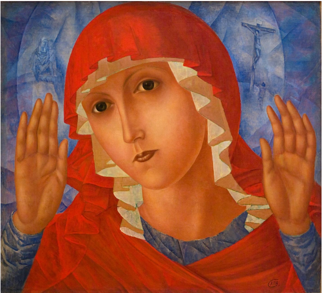
Кузьма Сергеевич Петров-Водкин. «Богоматерь Умиление злых сердец». 1914-1915.